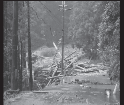
大畑瀬の越流で、通行止めとなった国道425号 (2011年9月4日)

2011年9月の台風12号による集中豪雨で壊滅的被害を受けた十津川村は、観光と林業を主な産業としていました。この十津川村の木材を率先して使用し、林業復興へ貢献する事を目的に建築家・工務店等の関係者が参加して立ち上げたプロジェクトです。